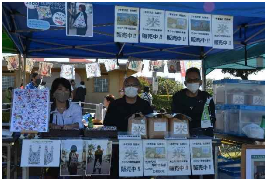
KISARAZU PALETTE フルカラーポリコットエコバッグ